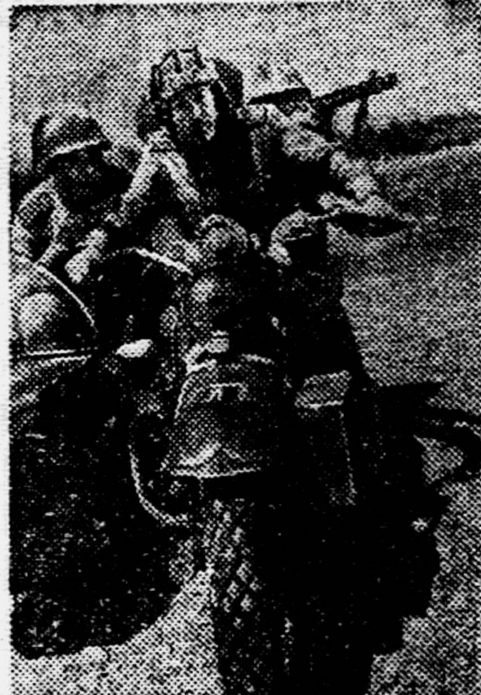
На левом берегу Вислы. Мотоциклисты-разведчики выходят на боевое задание.

С 20 по 25 августа войска 2-го и 3-го Украинских фронтов уничтожили и взяли в плен 205.400 вражеских солдат и офицеров, уничтожили и захватили 200 самолётов, 664 танка и самоходных орудия, 3.333 орудия, 2.330 миномётов, 15.596 пулемётов.